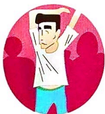
机械性的反复相似动作