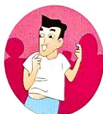
幻听、幻觉、妄想、言语不清