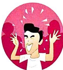
出汗、健谈、高兴异常