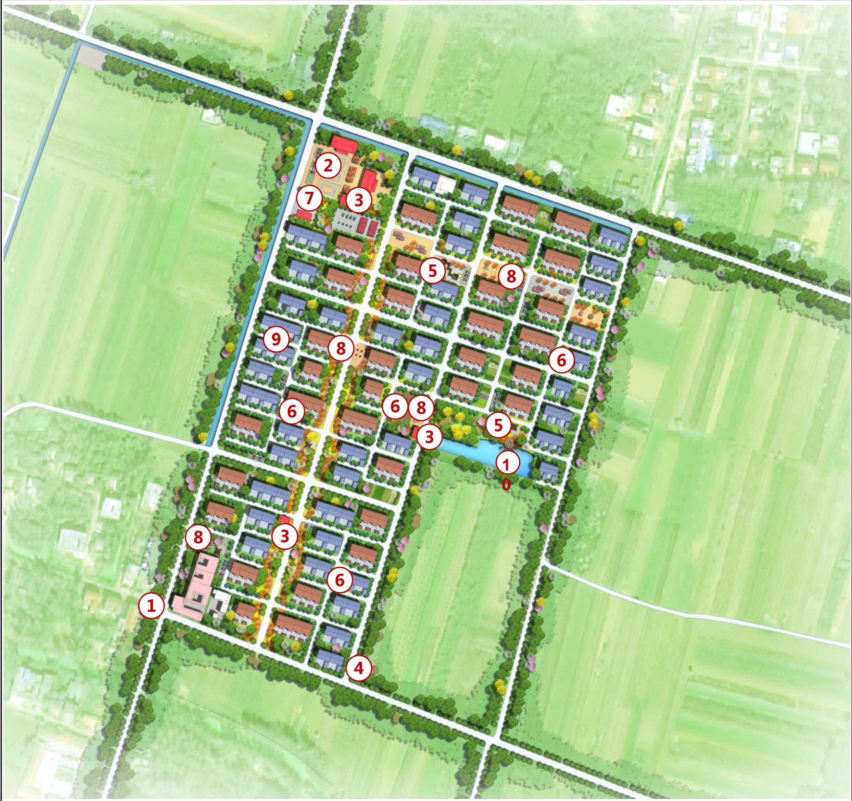
——重点区域规划总平面图